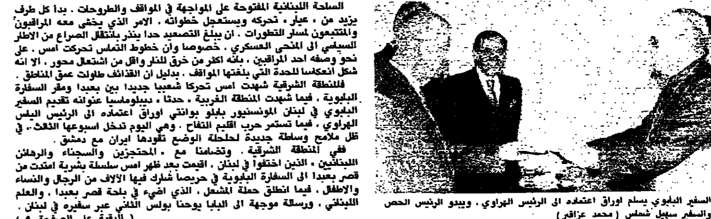
السفير البايوي يسلم اوراق اعتماد الى الرئيس الهراوي. ويبدو الرئيس الحص والسفير سبيل شمس (محمد عزاقر)